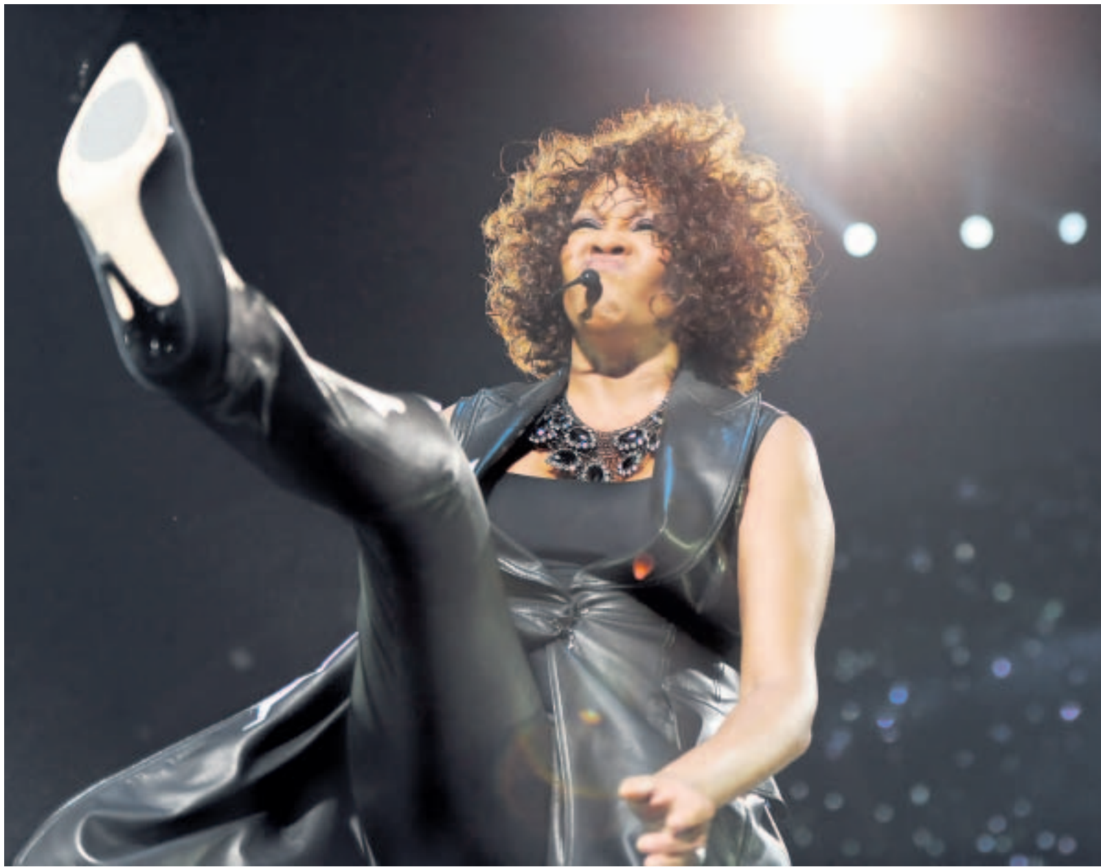
Whitney Houston bei ihrem Berliner Auftritt zum Auftakt einer Zehn-Städte-Tournee in Deutschland. Gestern Abend sang sie in Leipzig.