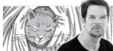
Kater Vivaldi hört mit Von Jens-Uwe Sommerschuh

Die meisten denken dabei aber an die legendäre Auffahrt des Herrn Jesus, der noch einmal seinen Aposteln erschienen war, um sie auf den heiligen Geist hinzuweisen. Ein gewisser Lukas bedichtete das später gar stimmungsvoll: „Und als er dies gesagt hatte, wurde er vor ihren Augen emporgehoben, und eine Wolke entzog ihm ihren Blicken. Und als sie ihm nachsa-